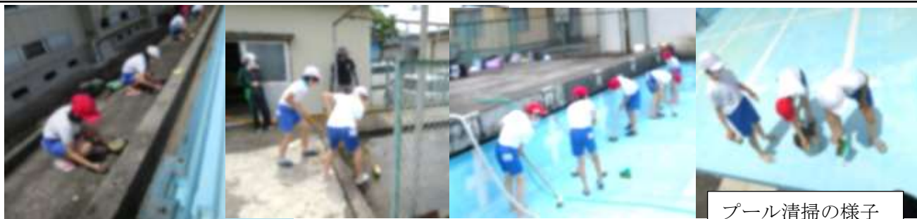
プール清掃の様子

<その他>・日焼けが気になる場合は、日焼け止めのクリームやラッシュガード着用などの対策をお願いします。