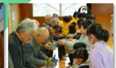
ヒヤシンス贈呈式