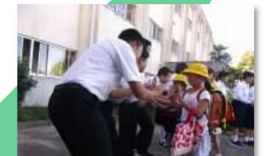
小中あいさつ運動