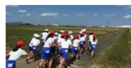
全校マラソン大会