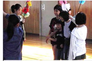
一年生を迎える会