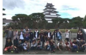
修学旅行(6年) 会津若松