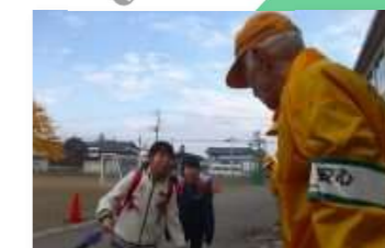
ひまわり会あいさつ活動