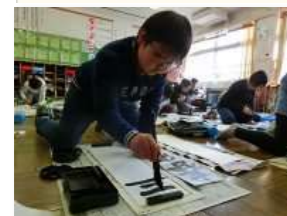
校内書き初め大会